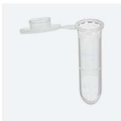
Udtagning af mælkeprøve