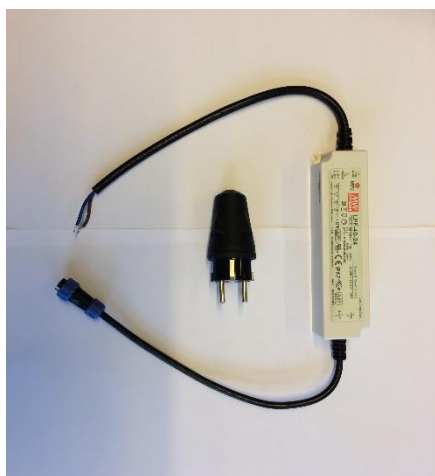
Udendørs AC til DC omformer

Den udendørs AC til DC omformer tilsluttes stikpanelet på bagsiden af detektionsboksen. Tilslut det runde hanstik på ledningen fra omformeren til indgang C på detektionsboksen, der er markeret med et solpanelikon samt et opladerikon.